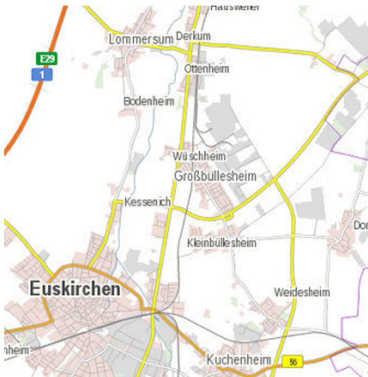
Abbildung 1 + 2: Übersichtskarte zur Lage des Plangebietes