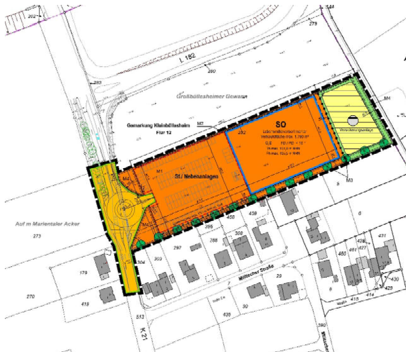
Abbildung 3: Bebauungsplanentwurf

© Dipl. Ing. Ursula Lanzerath, Veynauer Weg 22, 53881 Euskirchen, Planstand 11-2018